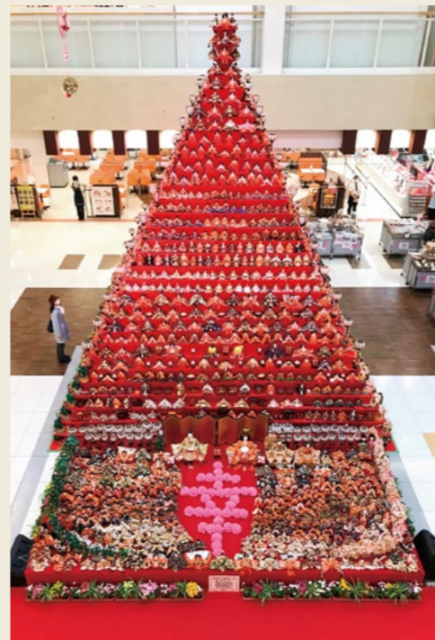
ピラミッドひな壇「幸」(2020年)