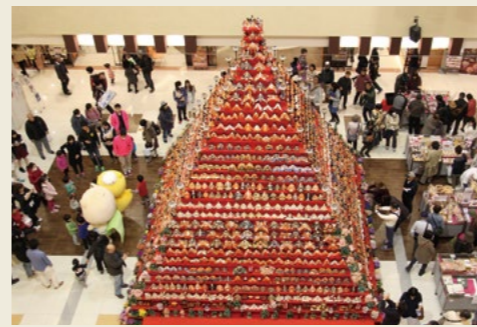
エルミこうのす「特産品販売」(2017年)