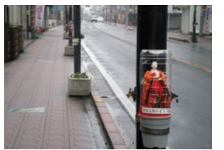
「中山道ひなめぐり」の 「ペットボトルひな」(2013年)