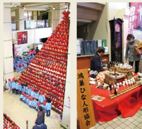
市役所「園児訪問」(左) 人形制作実演(右) (2011年)