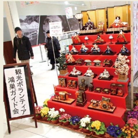
ガイド会ブース(上) ペットボトルひな壇(中) ひな壇アマビエ(下) (2019)