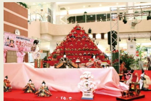
エルミここのす(2010年)