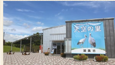
鴻巣市コウノトリ野生復帰センター 天空の里