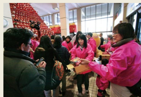
市役所「物産展」 市役所「ひなあられ配布」 (2013年)