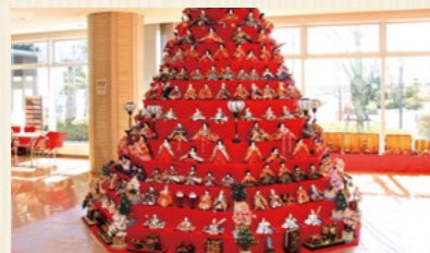
コスモスアリーナふきあげ