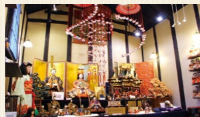
鴻巣市産業観光館 ひなの里