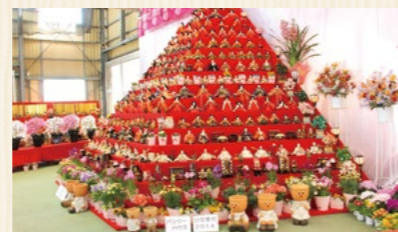
鴻巣農産物直売所 パンジーハウス