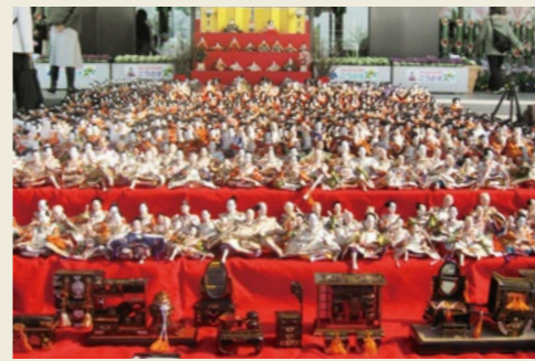
「川幡飾り&竹ひな」 (2009年)