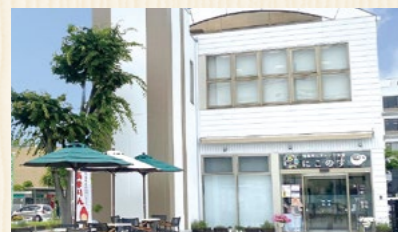
鴻巣市にぎわい交流館 にこのす