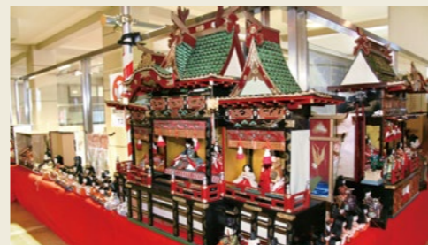
市役所「御殿飾り」(2007年)