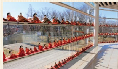
鴻巣市文化センター クレアこうのす